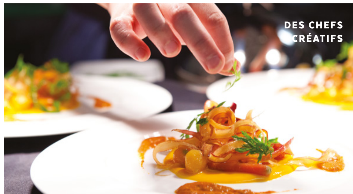
DES CHEFS CRÉATIFS