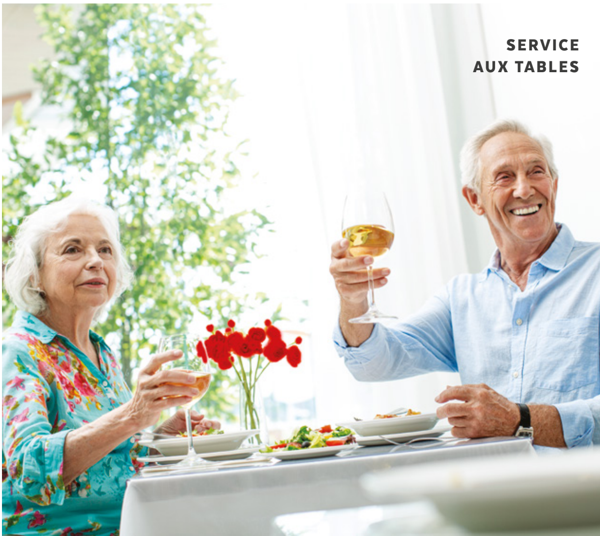
SERVICE AUX TABLES