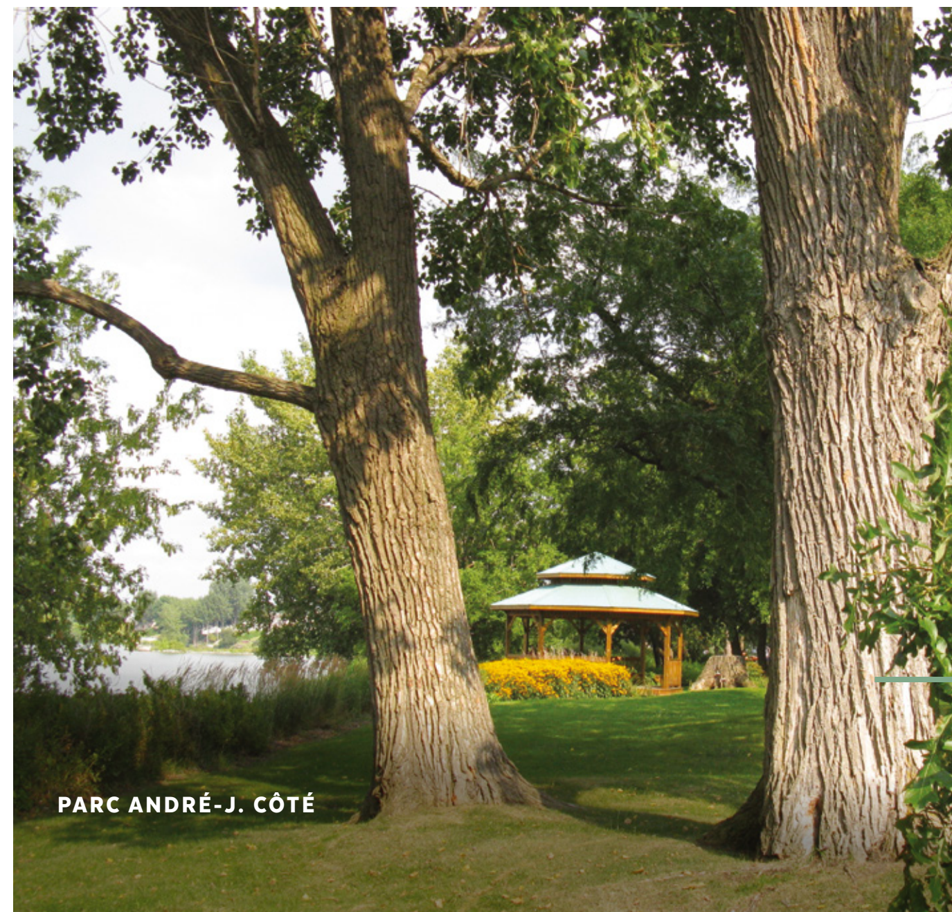
PARC ANDRÉ-J. CÔTÉ

Depuis sa fondation en 1957, Candiac ne cesse de ravir ses citoyens. Son engagement pour le développement durable, ses parcs, sa multitude de commerces et son environnement sécuritaire sont les ingrédients essentiels pour une retraite épanouissante. Candiac souffle un vent de fraîcheur sur le quotidien de chacun!