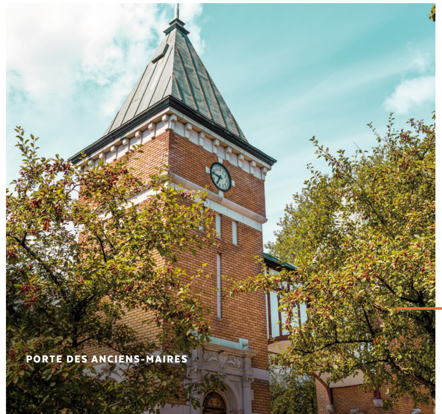
PORTE DES ANCIENS-MAIRES

Saviez-vous qu'autrefois, au Québec, aucun édifice ne dépassait la hauteur du clocher de la ville ? Bien sûr, cette tradition a évolué avec le temps, ce qui a permis à Cibèle de devenir, en 2024, le deuxième bâtiment le plus haut de Saint-Hyacinthe ! Un bel exemple de progrès qui offre par la même occasion une vue imprenable sur les environs !