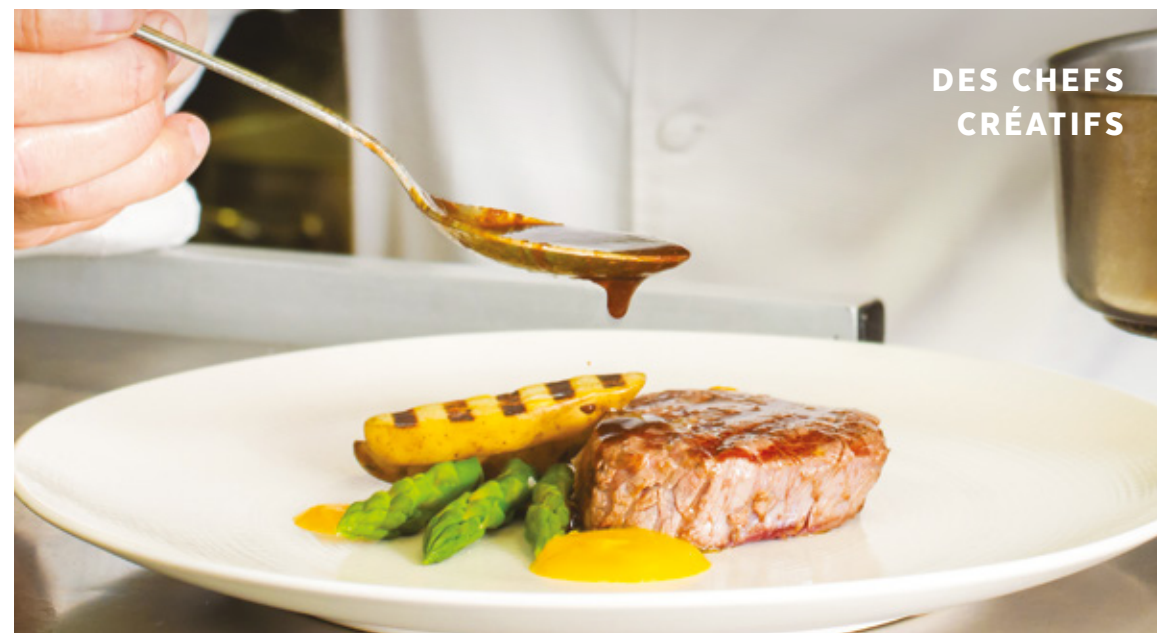
DES CHEFS CRÉATIFS